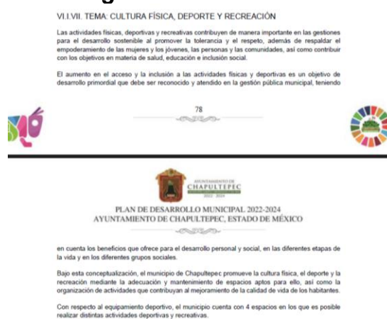
Imagen 1: Extracto del diagnóstico del PDM 2022-2024 de Chapultepec

La identificación de la problemática es respaldada por medio de los instrumentos de planeación como lo es el Plan de Desarrollo Municipal, es decir se cuenta con un diagnóstico en que se enmarca la existencia de infraestructura que puede ser utilizada por el IMCUFIDE de Chapultepec de la misma manera se encuadra una sección en donde se genera una breve descripción de la población, de la misma manera en términos del ejercicio 2023 los operadores del programa elaboraron un breve diagnóstico en términos de los talleres y actividades deportivas.